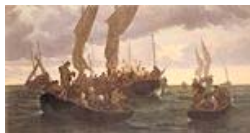
Résistance du catholicisme pendant la Révolution

Les insurgés récupèrent les armes confisquées par les municipalités. Des bandes se forment et attaquent sans succès Pierrefontaine-les-Varans le 4 septembre. Le 6 septembre une centaine d'entre eux affrontent la Garde nationale à Bonnétage au lieu dit « Le Grand Communal ». Les insurgés perdent la bataille - 20 morts, près de 200 se réfugient en Suisse - c'est la fin de l'insurrection.